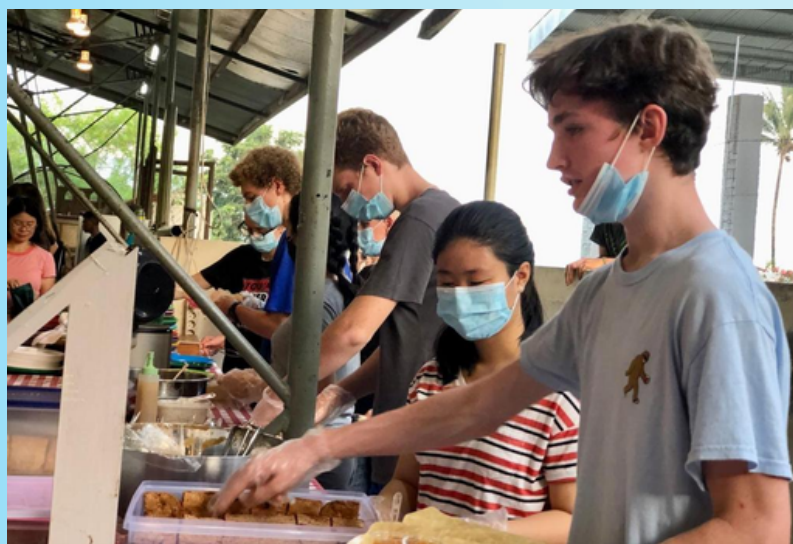
SOPHOMORES WORKING TOGETHER TO SERVE FRIDAY NIGHT MEAL AT THE VOLLEYBALL GAMES SISWA KELAS 10 BEKERJA SAMA UNTUK MENYAJIKAN MAKAN MALAM JUMAT DI PERTANDINGAN BOLA VOLI