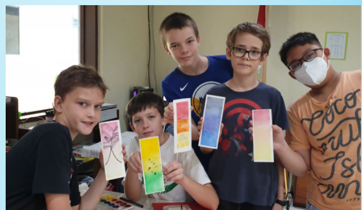
MIDDLE SCHOOL BOYS LEARNING NEW ART SKILLS ANAK LAKI-LAKI SMP MEMPELAJARI KETERAMPILAN SENI BARU