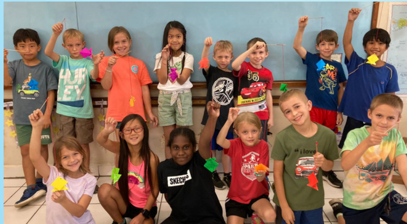
MAKING ORIGAMI FISH, LEARNING ABOUT HOW JESUS CALLED HIS DISCIPLES TO STOP FISHING FOR FISH AND MAKE THEM FISHERS OF MEN! MEMBUAT ORIGAMI IKAN, BELAJAR TENTANG BAGAIMANA YESUS MEMANGGIL MURID-MURIDNYA UNTUK BERHENTI MEMANCING IKAN DAN MENJADIKAN MEREKA PENJALA MANUSIA!