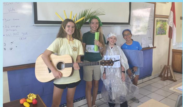
GRADE 8 SCIENCE PRESENTATIONS PRESENTASI SAINS KELAS 8